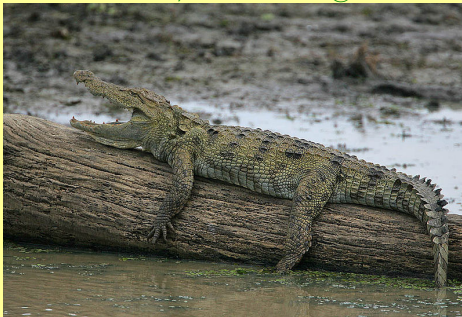
@מסיפוריו של חוקר חיות