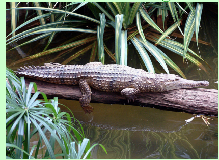
@מסיפוריו של חוקר חיות