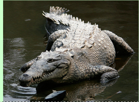
@מסיפוריו של חוקר חיות